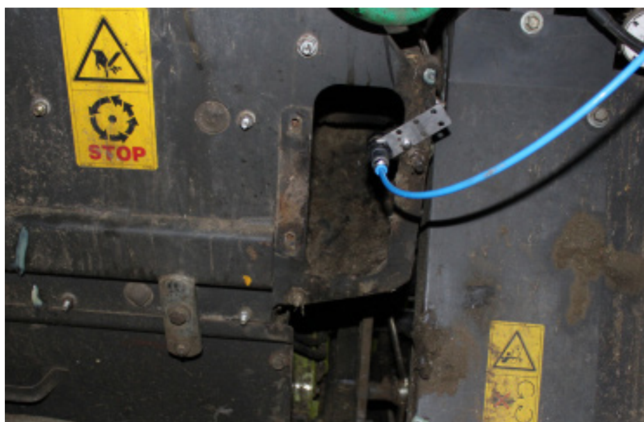
Umístění trysky do metače řezačky