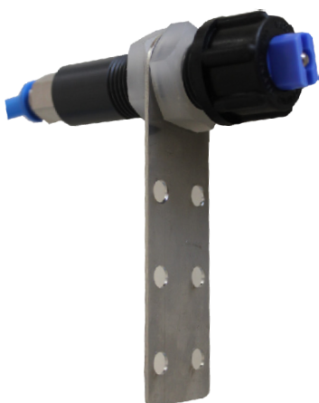
Tryska je snadno umístitelná. Nerezový držák se může případně ohnout